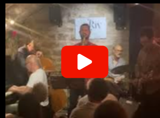
Live 38riv - 3 temps