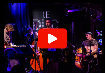
Live Duc des Lombards - From Nowhere