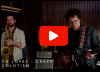
Vidéo Studio - Scolotism