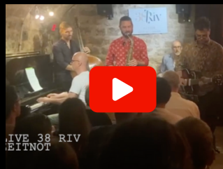
Live 38riv - Zeitnot